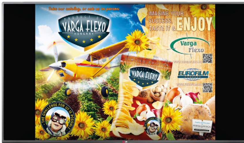
МОНИТОР С ВЫСОКИМ РАЗРЕШЕНИЕМ (FULL HD) 42» ДЛЯ ОТОБРАЖЕНИЯ ВСЕЙ ПЛОЩАДИ ОТТИСКА

Система контроля и инспекции полотна, являющаяся новой разработкой ООО Варга-Флексо, позволяет решить эту задачу.