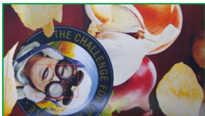
МОНИТОР 24" ДЛЯ ОТОБРАЖЕНИЯ ДЕТАЛЕЙ ОТТИСКА